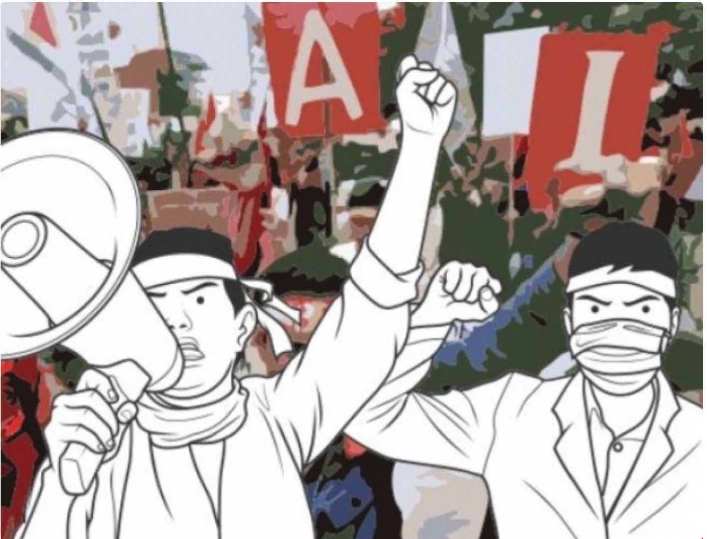
Ilustrasi Gambar Demo Masyarakat

PALANGKA RAYA - Paska divonis bebasnya bandar besar Narkoba, Salihin Bin Abdulah alias Saleh beberapa waktu oleh Majelis Hakim Negeri Pengadilan (PN) Palangka Raya, menuai kontroversi dan kecamatan masyarakat, khusus kota Palangka Raya.